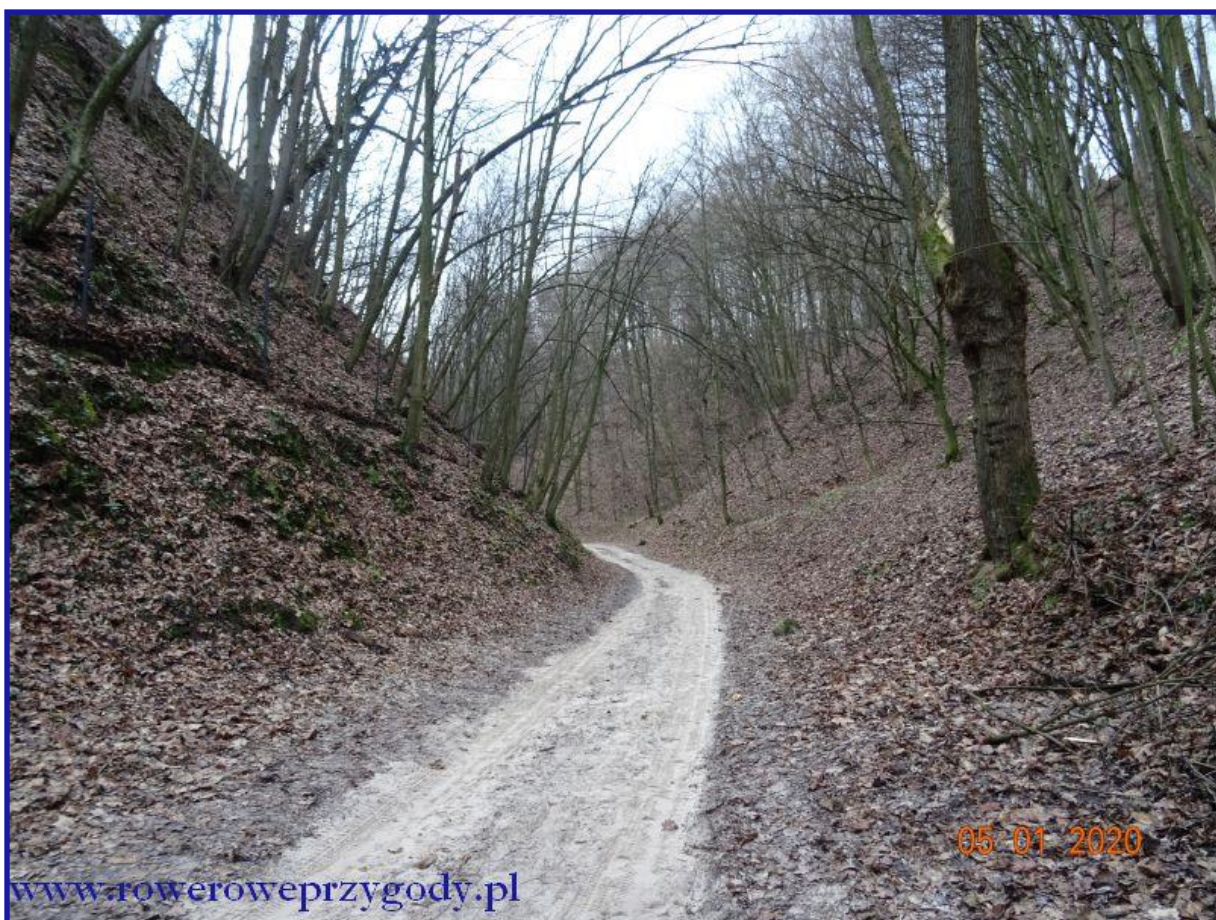
Zdjęcie nr 12 – Atrakcyjny krajobrazowo wąwóz Plebanka w Kazimierzu Dln.

Po dotarciu do miasteczka, zaparkujemy samochód (parking wedle uznania) i już pieszo podążamy w kierunku pierwszego z wąwozów, który znajduje się najbliżej Rynku tj. do wąwozu Plebanka (zdjęcie nr 12) .