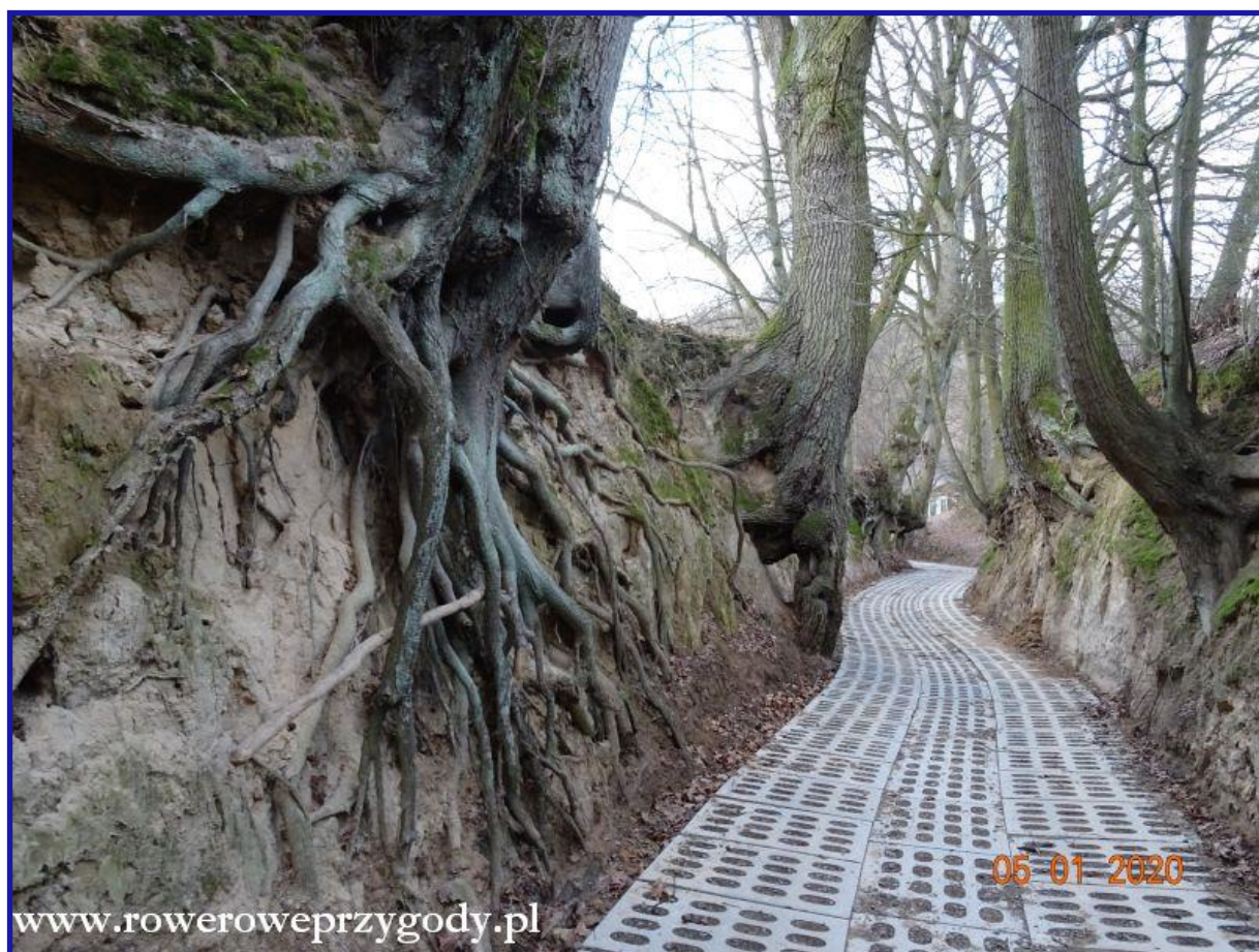
Zdjęcie nr 16 – Bardzo widowiskowy wąwóz Niezabitowskich w Kazimierzu.

Kolejnym wąwozem, który zobaczyliśmy tego dnia jest to wąwóz Niezabitowskich (zdjęcie nr 16) . Żeby do niego trafić, trzeba na wysokości Starej Chaty skrócić w prawą stronę i przejść niewielki odcinek drogi.