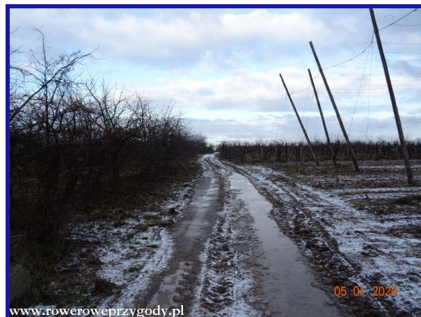
Zdjęcie nr 6 – Uprawy sadownicze na wierzchowinie Kazimierskiego Parku Krajobrazowego.