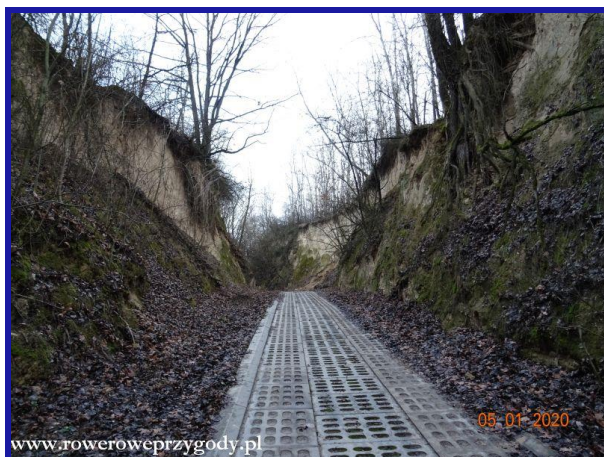
Zdjęcie nr 1 – Fragment wąwozu lessowego na trasie ścieżki przyrodniczej Dobrze- Podgórze.

Czas potrzebny na przejście powyższej ścieżki to 2-2,5 godziny. Wędrując nią będziemy mieli okazję ujrzeć przepiękne widoki Kotliny Chodelskiej, Małopolskiego Przełomu Wisły a także znajdujące się po przeciwnej stronie Wisły zamek w Janowcu. W źródłach internetowych można odnaleźć dokładny opis w/w ścieżki – link podałem na końcu w/w Opisu. Dlatego nie będę opisywać jej „krok po kroku”.