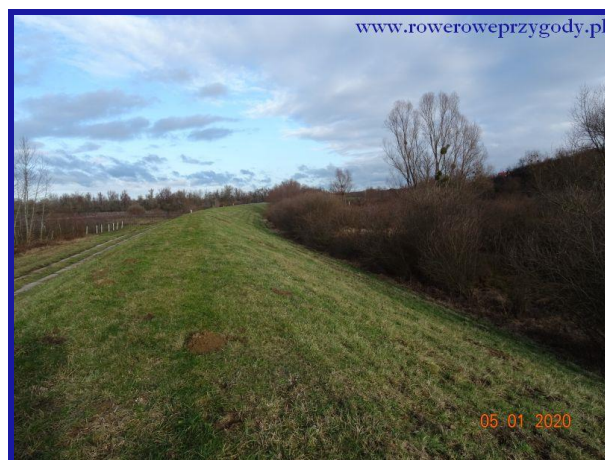
Zdjęcie nr 11 – Wał przeciwpowodziowy pomiędzy wsią Podgórz a miejscowością Dobre.