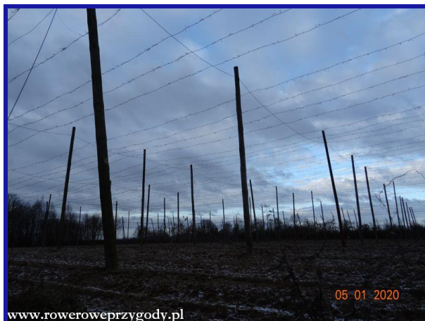
Zdjęcie nr 5 – Uprawy chmielu (chmielniki) na wierzchowinie Kazimierskiego Parku Krajobrazowego.