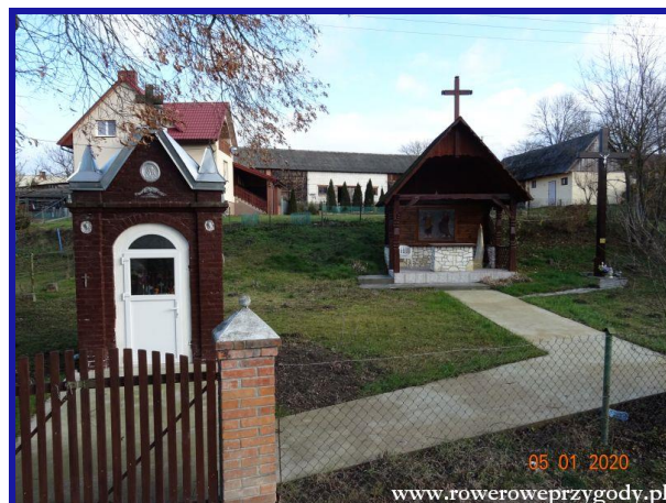
Zdjęcie nr 8 – Mała kapliczka we wsi Podgórz.

Ścieżka posiada dwa warianty zwiedzania: