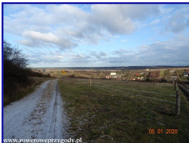
Zdjęcie nr 7 – Tereny rolnicze w okolicy wsi Podgórz k/ Kazimierza Dln.