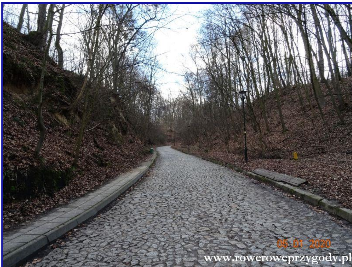
Zdjęcie nr 14 – Latwy do zwiedzania wąwóz Małachowskiego w Kazimierzu Dln.

Następnym wąwozem, który możemy dzisiaj odwiedzić jest znajdujący się w odległości ok. 200-300 metrów od wejścia do wąwozu Plebanka, wąwóz Małachowskiego (zdjęcie nr 14) .