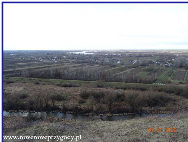
Zdjęcie nr 3 – Widok ze Skarpy Dobrskiej na Kotlinę Chodelską (z przodu zdjęcia widać rzekę Chodelkę).