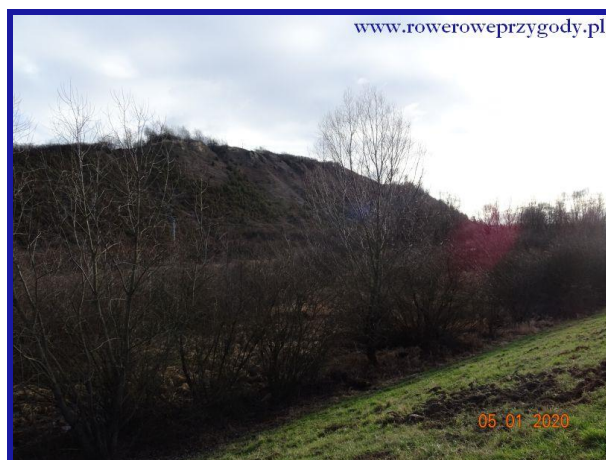
Zdjęcie nr 10 – Widoczna w oddali Skarpa Dobrská.