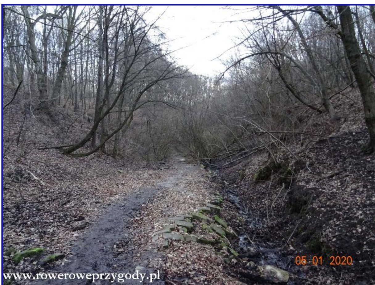
Zdjęcie nr 19 – Najbardziej naturalny i dziki wąwóz w Kazimierzu – wąwóz Norowy Dół.

Wąwóz Norowy Dół (zdjęcie nr 19). - najbardziej dziki wąwóz w okolicach Kazimierza, w którym wędrujemy wąską ścieżką między zwalonymi pniami drzew. Fragment wąwozu wiedzie przez utwardzoną drogę, która miała być fragmentem komunikacyjnym między ul. Puławską a wsią Góry.