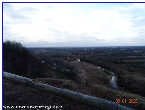
Zdjęcie nr 2 – Widok ze Skarpy Dobrskiej na Kotlinę Chodelską i dolinę Wisły w okolicy wsi Dobrze.