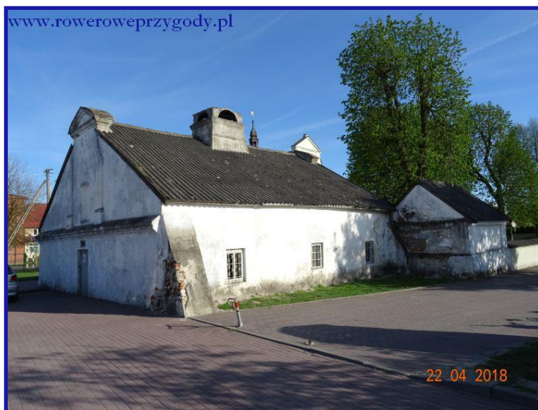
Zdjęcie nr 2 - Zabytkowy szpitalik-przytułek dla ubogich, po prawej stronie widoczna dawna przykościelna kostnica.