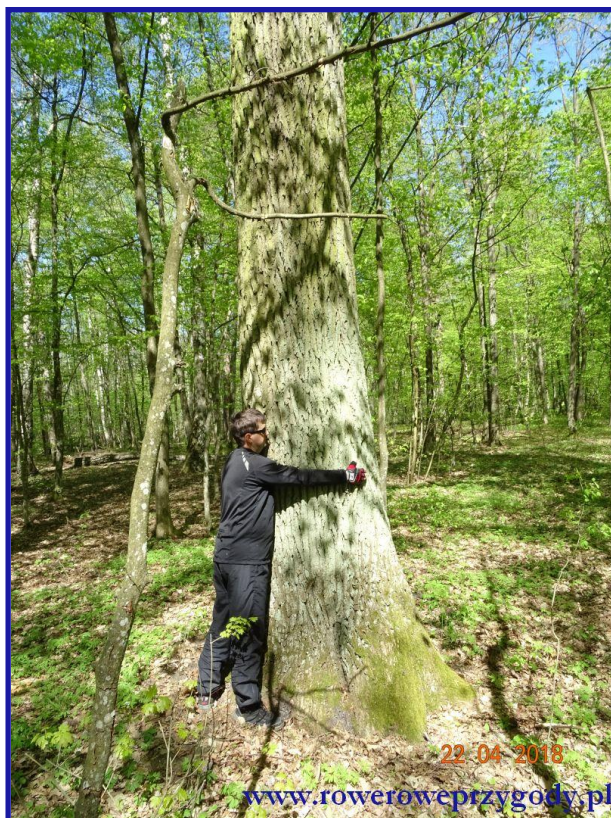
Zdjęcie nr 10 – Jeden z wielu starych dębów rosnących w rezerwacie Bachus.

mieszanym. Co zwraca uwagę, poruszając się przez rezerwat to rosnące, bardzo duże i stare dęby i sosny ( zdjęcie nr 10 ). Również na naszej drodze zobaczymy mnóstwo zwałonych pni drzew, które w sposób naturalny ulegają rozkładowi. Widok ten jest naprawdę niezwykły, gdyż częściowo pozwala przenieść się w dawne czasy, kiedy to tereny Polski były pokryte nieprzebytymi puszciami a widok leżących pni dużych drzew był dosyć częstym widokiem dla ówczesnych mieszkańców tych terenów. Tak jak pisałem wcześniej, ciekawostką rezerwatu Bachus są tzw. lejki krasowe – czyli bezodpływowe zagłębienia w terenie o średnicy od kilku metrów do kilkudziesięciu o głębokości do 5 metrów ( zdjęcie nr 11 ).