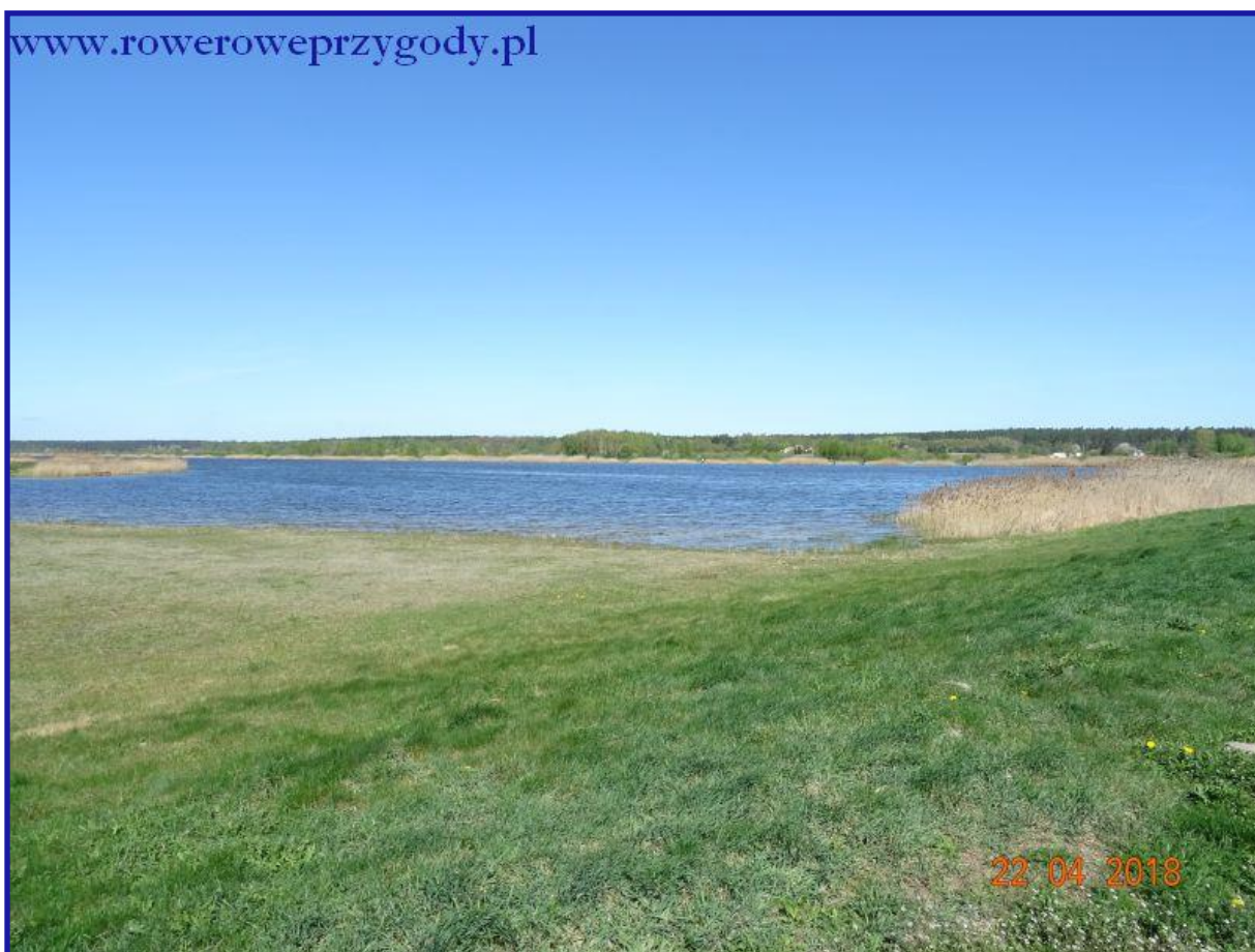
Zdjęcie nr 5 - Sztuczny zbiornik retencyjny w Sawinie zwany Niwą.

Zbiornik ten wykorzystywany jest obecnie przez wędkarzy, ale także przez mieszkańców Sawina i okolic. Choć jak rozmawiałem z jednym z radnych Sawina, według wielu osób umiejscowienie zbiornika zostało wybrane niefortunnie, gdyż na dawnych torfowiskach. Powoduje to, że dno zbiornika pełne jest ciemnego błota, co nie jest zachęcające do kąpienia podczas letnich upałów.