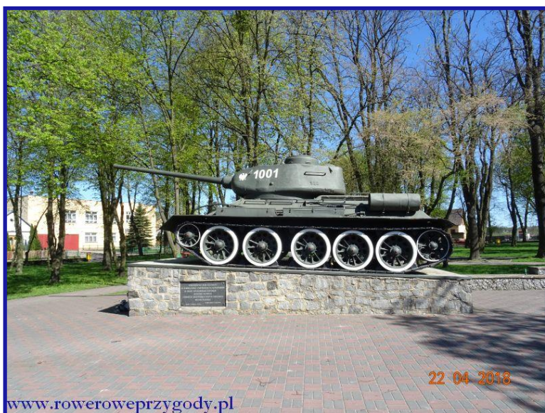
Zdjęcie nr 3 - Pomnik upamiętniający pomoc mieszkańców Sawina w tworzeniu Pierwszego Drezdeńskiego Korpusu Pancernego Wojska Polskiego w czasie II Wojny Światowej.

Po obejrzeniu zabytkowego kościoła, wyruszamy dalej. Naszym pierwszym celem będzie duży zbiornik retencyjny w okolicy Sawina, zwany Niwą . Sztuczny zbiornik, powstały na dawnych torfowiskach pełni funkcję rekreacyjną dla mieszkańców Sawina i okolicznych miejscowości. Zanim jednak do niego dojedziemy (najlepiej zapytać się o drogę), po drodze