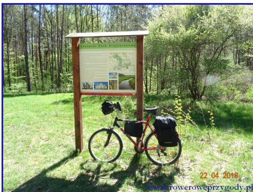
Zdjęcie nr 7 – Tablica informacyjna na początku ścieżki przyrodniczej „Bachus”.

Poruszanie się rowerem tą ścieżką w formie drogi leśnej, to sama przyjemność (zdjęcie nr 8) . Jednakże wspomnę, że w kilku miejscach niestety trzeba rower podprowadzić, ze względu na dosyć duże zapiaszczenia. Ale myślę, że otaczający nas wielogatunkowy las z