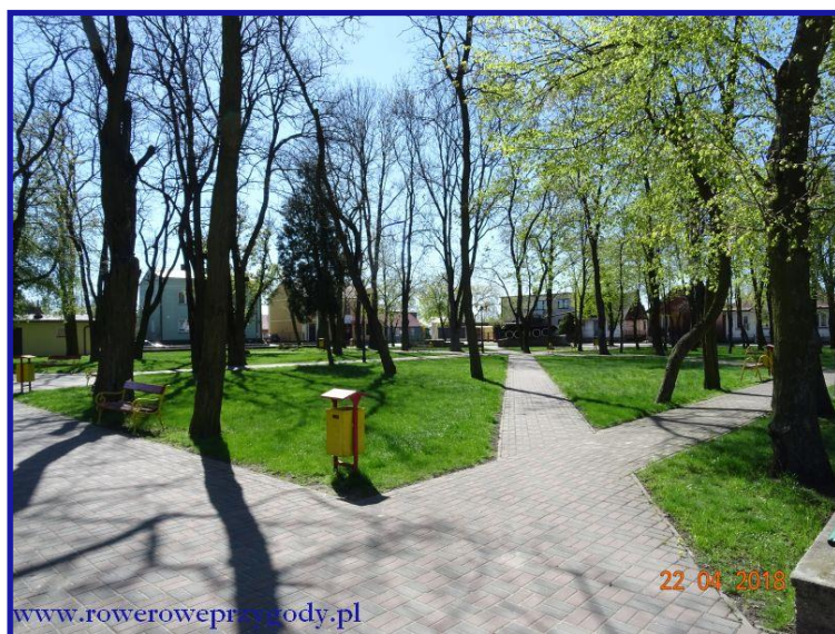
Zdjęcie nr 4 - Centrum Sawina przy ulicy Rynek, przypominający park lub skwer.

Pancernego Wojska Polskiego. Pomnik znajduje się przy ulicy Rynek, która okala miejsce, przypominające skwer lub mały park. Ładnie skomponowane z drzew, miejsce z ławeczkami, które znajdują się przy alejkach z kostki brukowej ( zdjęcie nr 4 ). Nasyciwszy oczy ładnym widokiem parku, podążamy dalej w kierunku zbiornika Niwa , do którego dotrzemy dosyć szybko. Zbiornik ten jak napisałem został stworzony sztucznie w 2010 r., posiada powierzchnię ok. 52 ha i średnią głębokość 2 metrów ( zdjęcie nr 5 ).