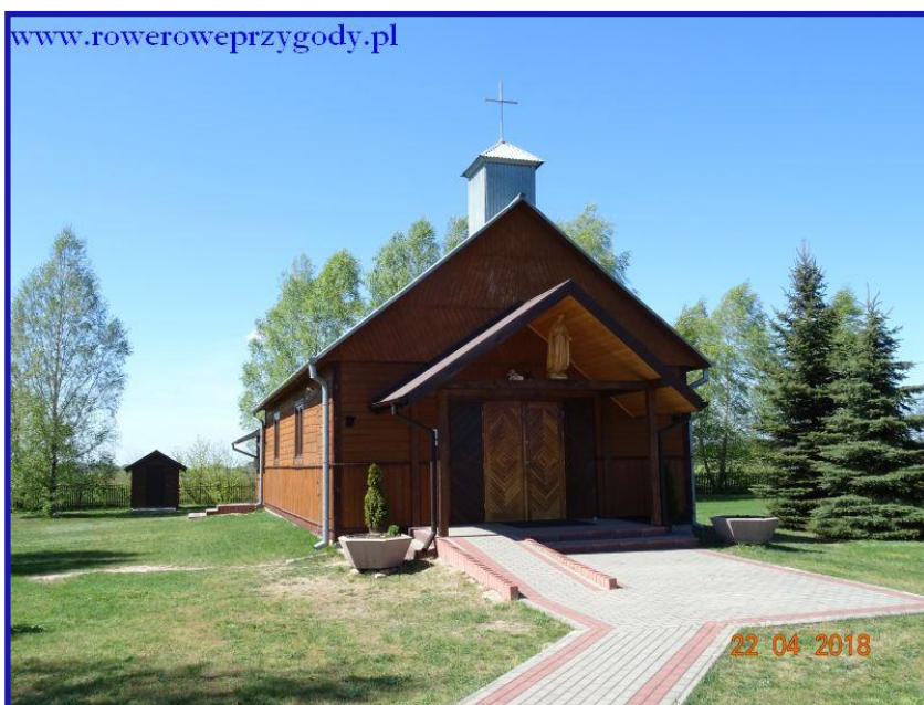
Zdjęcie nr 13 – Kaplica w Chutczu, należąca do parafii pw. Przemienienia Pańskiego w Sawinie.

Minąwszy pomnik powoli opuszczamy tereny leśne i wyjeżdżamy na bardziej otwarte tereny, co oznacza, że całkiem niedługo dojedziemy do miejscowości Chutcze . Po drodze miniemy odchodzącą w prawą stronę drogę do wsi Bachus, a także oddaloną o około 100 metrów, znajdującą się po lewej stronie drogi, ambonę myśliwską. Chwilę później wjedziemy do wsi Chutcze, gdzie miniemy po lewej stronie drogi, mały drewniany kościółek – kaplicę , należącą do parafii pw. Przemienienia Pańskiego w Sawinie ( zdjęcie nr 13 ). Przejeżdżamy jeszcze kilkaset metrów i dojedziemy do bocznej drogi asfaltowej, odchodzącej w prawą