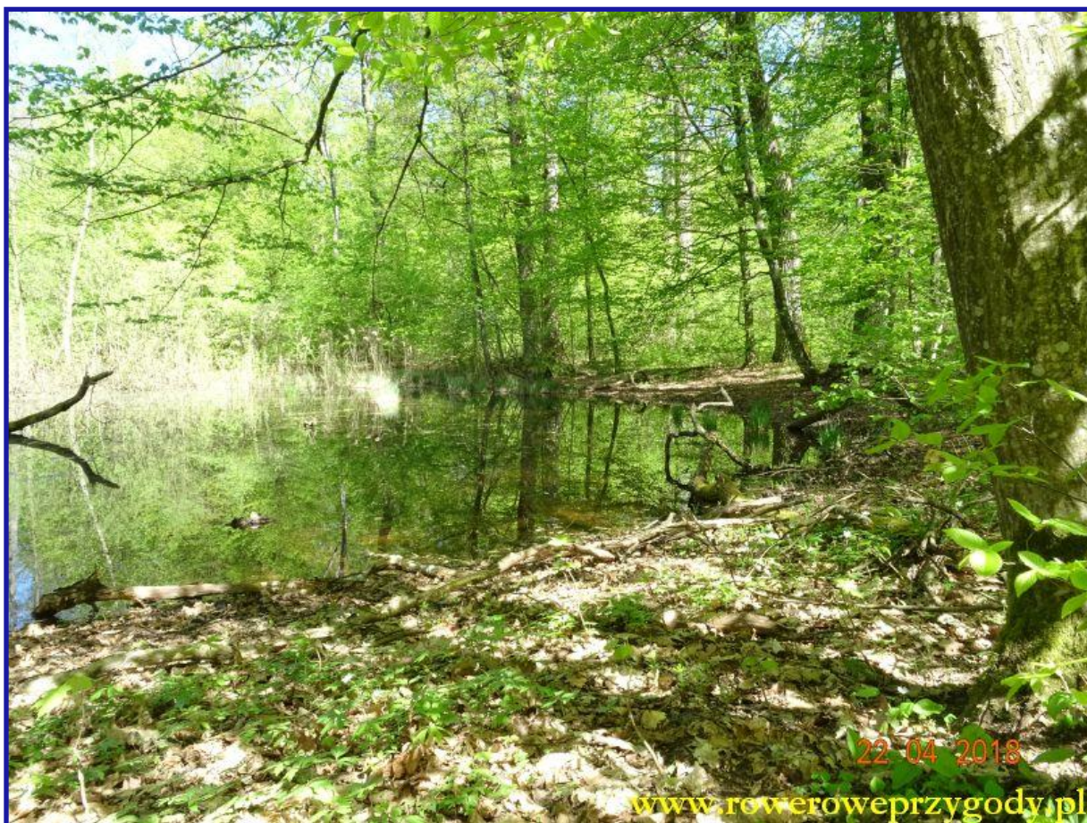
Zdjęcie nr 11 – Jeden z tzw. lejków krasowych występujących na terenie rezerwatu Bachus.

Jak możemy przeczytać na tablicy informacyjnej, lejki krasowe powstały na skutek rozpuszczania się skały wapiennej, na skutek działania wody bogatej w dwutlenek węgla (zawartego w powietrzu jak i w glebie na skutek rozkładu substancji humusowych).