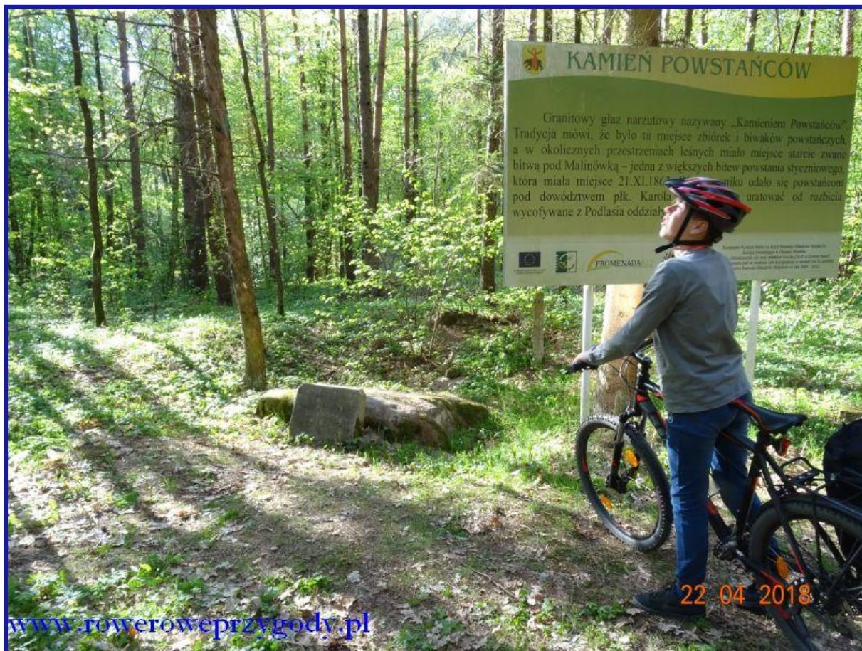
Zdjęcie nr 15 – Kamień Powstańców w okolicy Sawina – dawne miejsce zbiórek i biwaków Powstańców Styczniowych z 1863 r.

To już koniec dzisiejszej wycieczki. Trochę szkoda, że nie zobaczyliśmy rezerwatu Serniawy jak również jeziora Słonego ale i tak atrakcji było sporo. Niewątpliwie należy do nich rezerwat Bachus , którego widok z pewnością na długo pozostanie w pamięci.