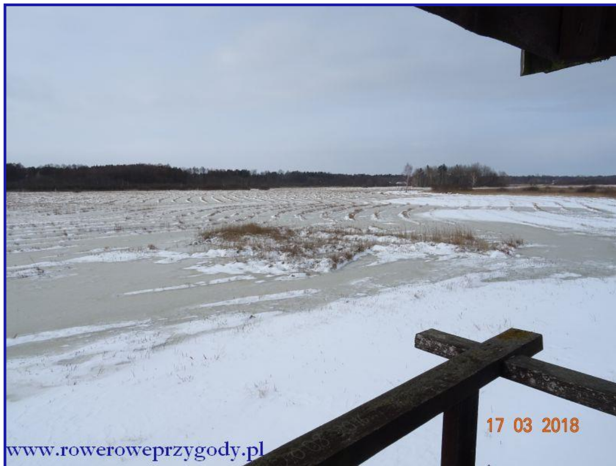
Zdjęcie nr 15 - Widok z wieży widokowej na Chełmskie Torfowiska Węglanowe.

Widok z wieży jest urzekający, pomimo zalegającej na torfowisku pokrywy śnieżnej (zdjęcie nr 15).