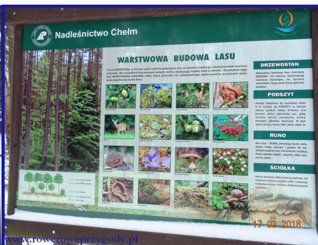
Zdjęcie nr 4 - Tablica edukacyjna pt. „Wyluszcznia” na terenie ścieżki przyrodniczej „Stańków”