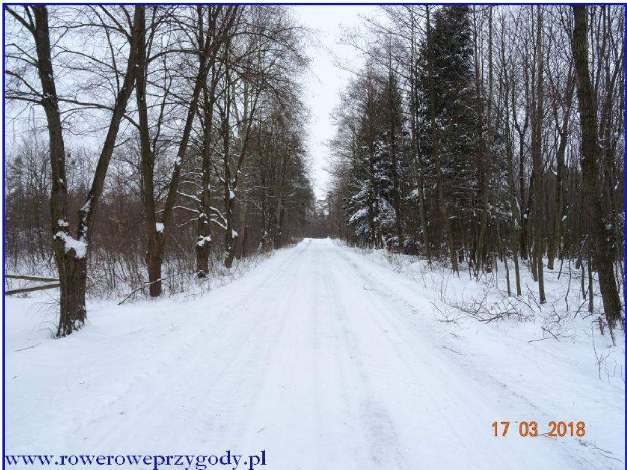
Zdjęcie nr 6 - Droga leśna w okolicy Stańkowa – fragment ścieżki przyrodniczej „Stańków”.

Po przejściu około kilkaset metrów od pierwszej tablicy edukacyjnej, dojdziemy do ciekawego miejsca, jakim jest dawna wyluszcarnia – murowany domek pochodzący z 1949 r. oraz znajdujący się obok duży, drewniany budynek z 1955 r., pełniący dawniej funkcję magazynu szyszek ( zdjęcie nr 7 ).