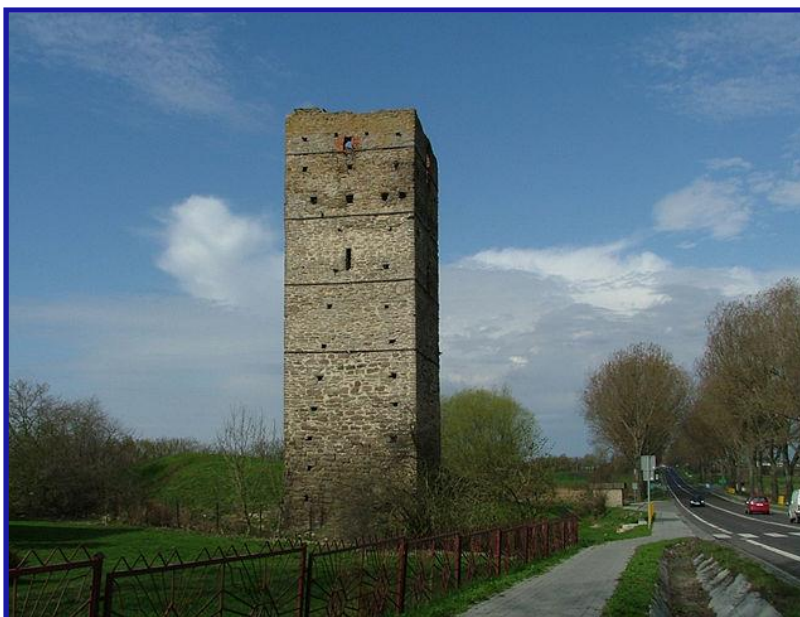
Zdjęcie nr 2 - Kamienna Wieża w Stolpiu (źródło – Wikipedia – dokładny link na końcu Opisu).

Zwiedzając tereny Parku mamy okazję podziwiać wczesnośredniowieczne grodziska np. w Sajczycach, Czulezycach, Busównie . Niezwykle interesująca jest najstarsza budowla po prawej stronie Wisły tj. pochodząca z IX-XI kamienna wieża w Stolpiu , mająca charakter mieszkalno-sakralno-obronny. (zdjęcie nr 2).