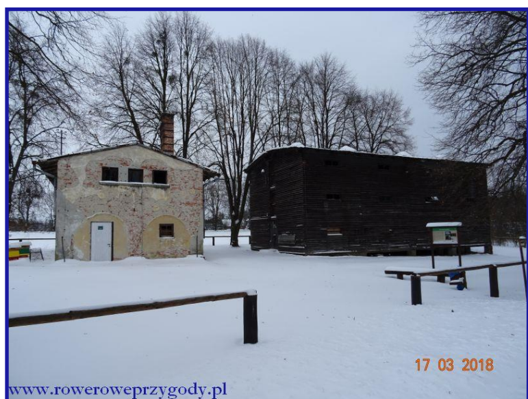
Zdjęcie nr 7 - Budynki pełniące funkcję wyluszcarni w okolicy Stańkowa.

Oba te budynki służyły do bardzo ważnej czynności leśnej – tj. wydobyciu nasion z szyszek, używanych później do nowych nasadzeń. Szczegółowo proces uzyskiwania materiału siewnego został opisany na pobliskiej tablicy informacyjnej. Znajdując się w pobliżu obu