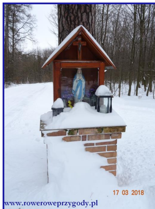
Zdjęcie nr 9 - Mała kapliczka na ścieżce przyrodniczej Stańków.

Warto tam podejść, gdyż budynki te są zabytkowe i mają około 100 lat. Z kolei jeśli spojrzymy na prawą stronę, zobaczymy węższą drogę, która odchodzi w głąb lasu. Oczywiście w tą drogę udamy się w drodze powrotnej. Tak więc dalej zmierzamy prosto naszą szeroką drogą leśną, zmierzając do kolejnych tablic edukacyjnych. Tak spacerując, niebawem dojdziemy do asfaltowej szosy, co oznacza, że możemy zawrócić i ponownie udać się do znanej nam już kapliczki. Na jej wysokości skręcamy w drogę, o której wspominałem wcześniej, odbiegającą tym razem w lewą stronę.