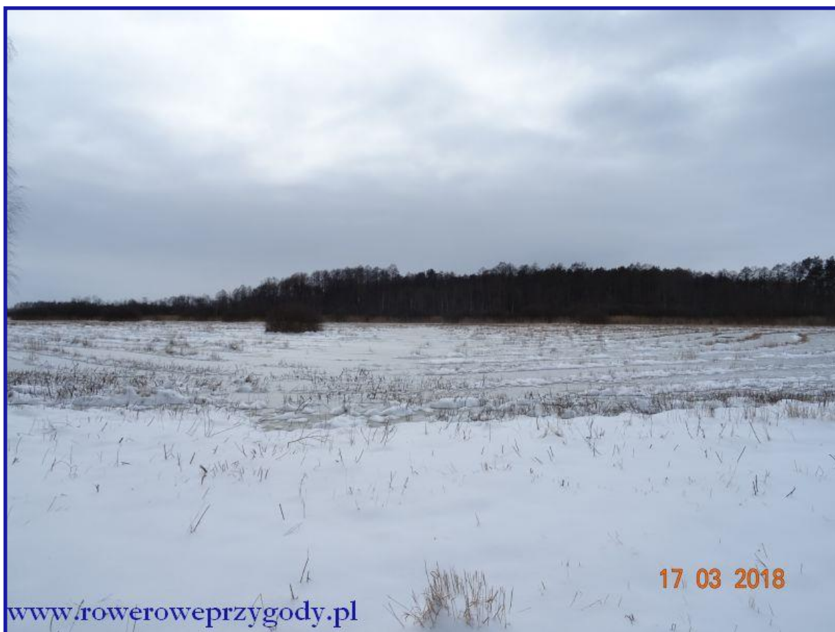
Zdjęcie nr 13 - Przysypane śniegiem torfowiska węglanowe w rezerwacie „Bagno Serebryskie”.

Szkoda, bo aura zimowa spowodowana nagłym powrotem zimy po kilku dniach ładnej, cieplej pogody nie pozwoliła na delectowanie się widokiem terenów torfowiskowych ( zdjęcie nr 13 ).