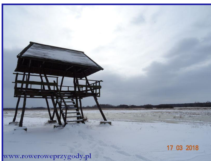
Zdjęcie nr 14 - Wieża widokowa w rezerwacie „Bagno Serebryskie”

Wędrując drogą polną, prowadzącą skrajem torfowiska zobaczymy w oddali wieżę widokową, do której podążymy, żeby poobserwować tereny torfowiskowe z kilkumetrowej wysokości ( zdjęcie nr 14 ). Wieża jest całkiem solidna, sam osobiście sprawdziłem tak więc śmiało można wejść na nią nawet z dziećmi.