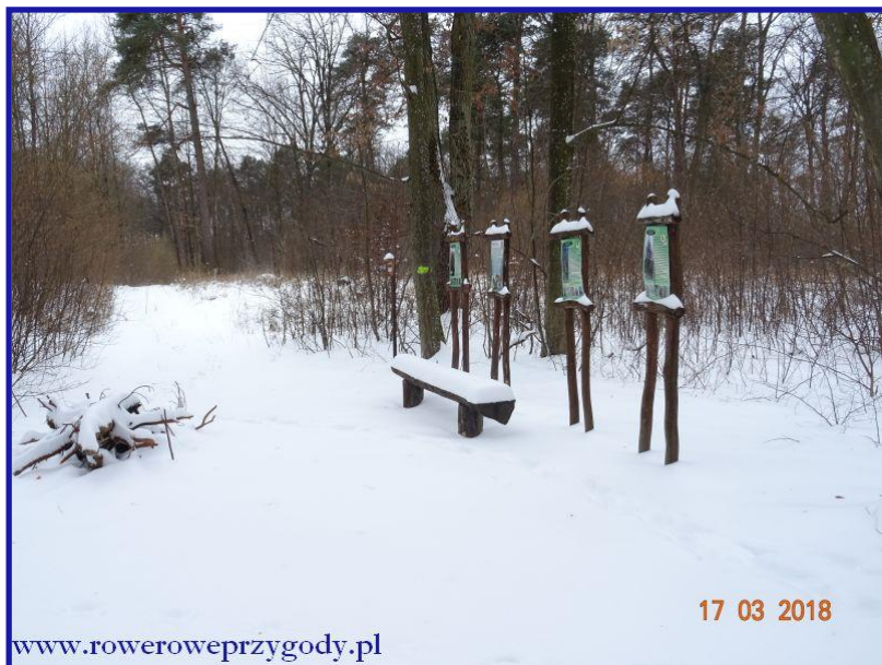
Zdjęcie nr 11 - Zakończenie ścieżki przyrodniczej „Stańków” .

No cóż, wszystko co dobre kiedyś się kończy. Tak więc i nasza przygoda ze ścieżką przyrodniczą Stańków . Teraz możemy wracać do samochodu, gdzie potem udamy się do kolejnej atrakcji dzisiejszego dnia tj. do ścieżki przyrodniczej „Bagno Srebrskie” .