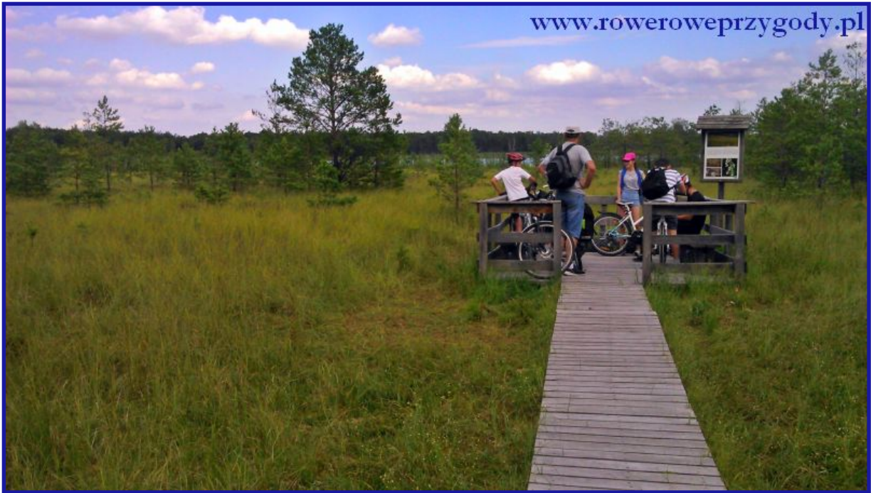
Zdjęcie nr 15 – Widoczne w oddali jezioro „Moszne” na ścieżce przyrodniczej „Dąb Dominik”.

Ścieżka przyrodnicza „Dąb Dominik” - rozpoczyna się w miejscowości Łomnica, długość podstawowej trasy ścieżki wynosi 2,5 km, a jej dłuższy wariant 3,5 km. Co ciekawe ścieżka częściowo przystosowana jest do zwiedzania przez osoby niepełnosprawne, które mogą się poruszać po szerokich kładkach. Osoby wędrujące ścieżką mają okazję poznać różne środowiska i typy lasów np. grąd niski, ols, bór bagienny a także zarastające jezioro Moszne (zdjęcie nr 15).