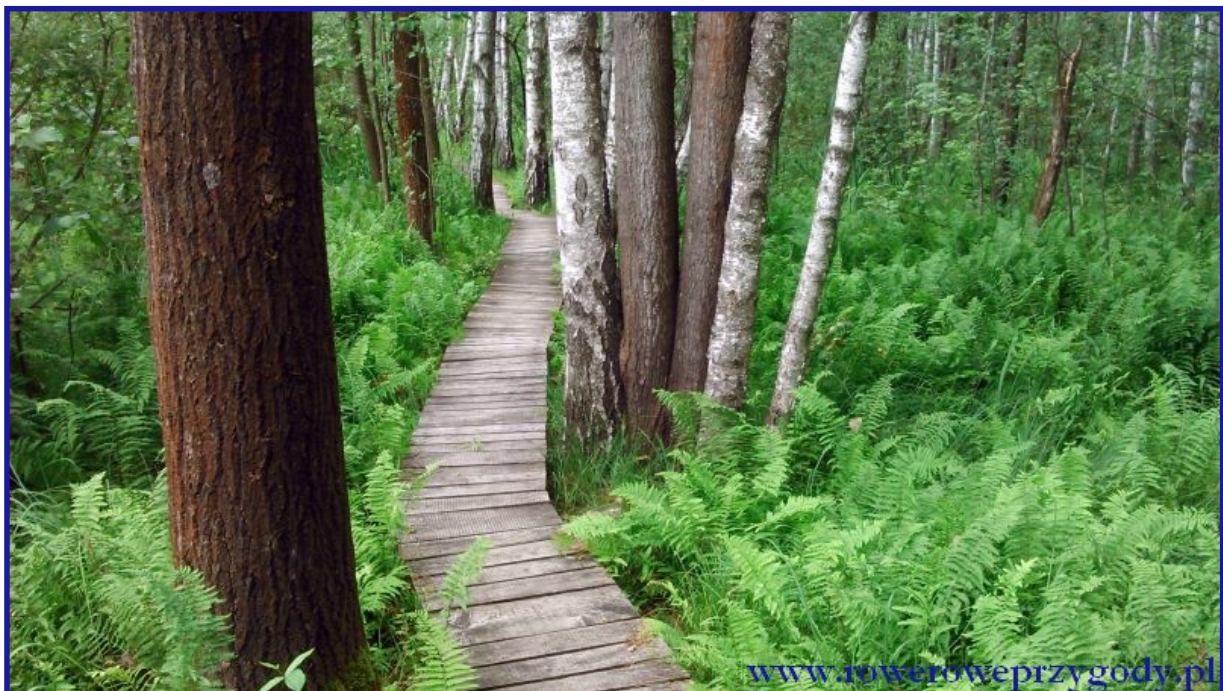
Zdjęcie nr 10 – Kolejny fragment drewnianej kładki na ścieżce przyrodniczej „Splawy”.

Poniżej jeszcze umieściłem jedno zdjęcie, które przedstawia kolejny fragment kładki na ścieżce „Splawy” ( zdjęcie nr 10 ).