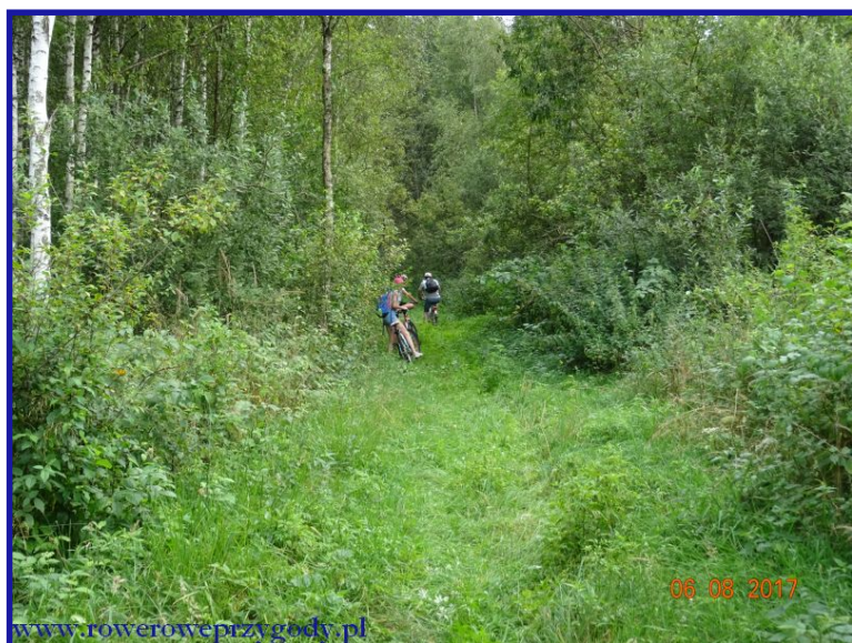
Zdjęcie nr 20 – Droga leśna, nieprzystosowana dla rowerów.

trzeba miejscami rower podprowadzić. Pełna jest dziur, wykrotów a miejscami w ogóle nie można nazwać jej drogą (zdjęcie nr 20) .