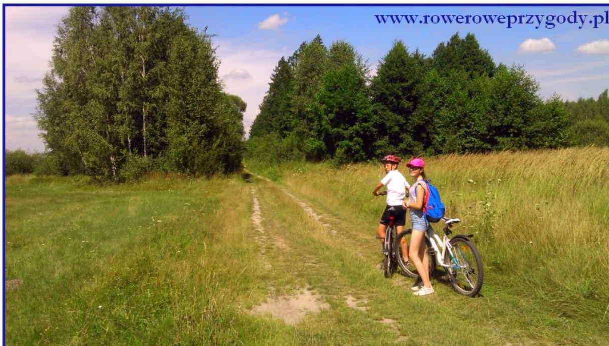
Zdjęcie nr 11– Droga polna, którą podążamy po opuszczeniu ścieżki przyrodniczej „Splawy”.

11). Naszym kolejnym celem będzie również inna, znana atrakcja Poleskiego Parku tj. Ścieżka Przyrodnicza „Dąb Dominik”, oddalona stąd o około 5 kilometrów.