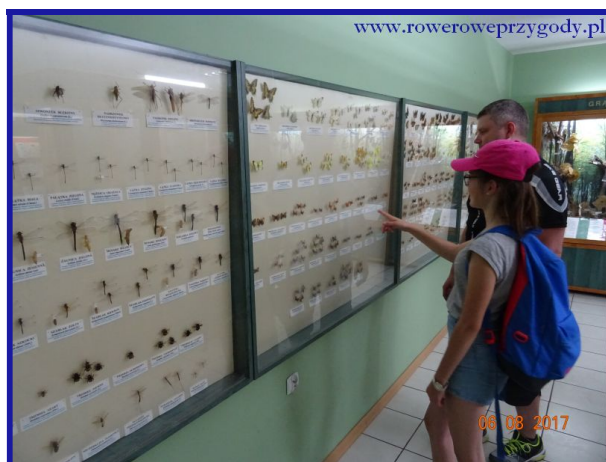
Zdjęcie nr 5 – Ekspozycje owadów w muzeum w Starym Żaluczu.

skręcamy w prawą stronę i przez moment będziemy poruszać się początkowo pośród pól i łąk, by później minąć las liściasty i dojechać do drogi asfaltowej, na której skręcimy w prawą stronę i po około 300 metrach dojedziemy do Ośrodka Dydaktyczno-Muzealnego w Starym Żaluczu . Gorąco zachęcam do obejrzenia eksponatów m.in. przyrodniczych, etnograficznych i historycznych, związanych z tutejszą okolicą, znajdujących się w budynku Muzeum oraz wystawy starych maszyn rolniczych, umiejscowionych na terenie Muzeum (zdjęcia nr 5,6).