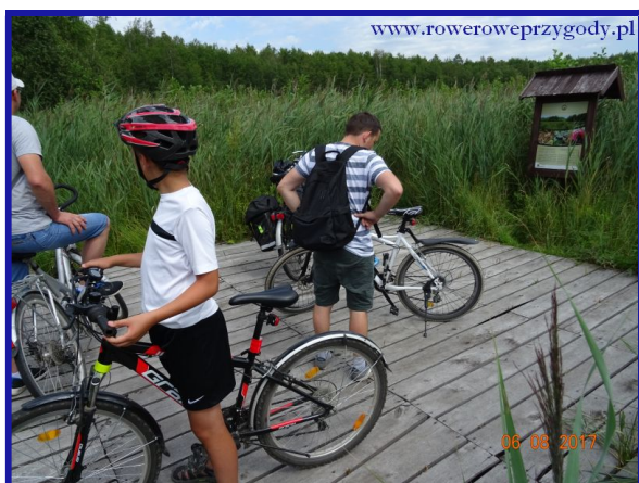
Zdjęcie nr 7 – Jeden z przystanków tematycznych na Ścieżce przyrodniczej „Splawy”.

Na ścieżce znajduje się osiem przystanków tematycznych, z których ostatni znajduje się nad jeziorem „Łukie” (zdjęcia nr 7,8).