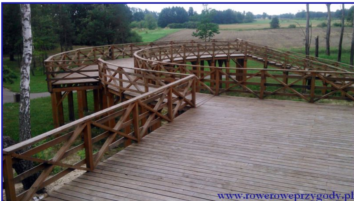
Zdjęcie nr 1 - Drewniany pomost „widokowy” w okolicy Urszulina.

Po zakupie biletów i wypakowaniu rowerów, wyjeżdżamy na drogę główną i skręcamy w prawą stronę, by po około dwustu metrach ponownie skręcić na skrzyżowaniu w lewą stronę w kierunku miejscowości Sosnowica . Po drodze mijamy ciekawą, ale nie do końca jasną dla mnie konstrukcję drewnianą, przypominającą pomost widokowy ( zdjęcie nr 1 ).