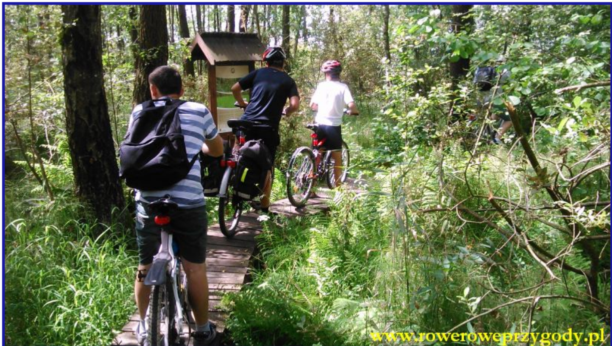
Zdjęcie nr 9 – Jedna z wielu, niezbyt szerokich drewnianych kładek na ścieżce przyrodniczej „Splawy”.