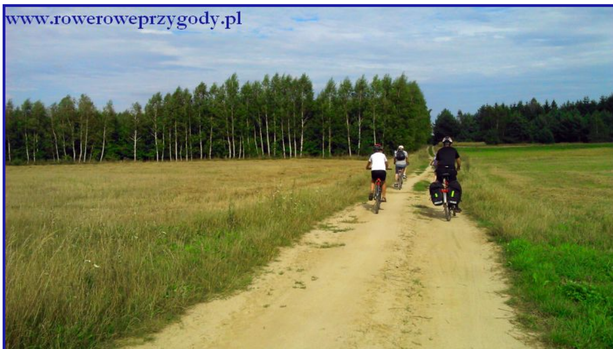
Zdjęcie nr 21 – Droga polna, prowadząca do Zawadówki.

skręcić w drogę polną, odchodzącą w lewą stronę, która doprowadzi nas do widocznego w oddali lasu (zdjęcie nr 21).