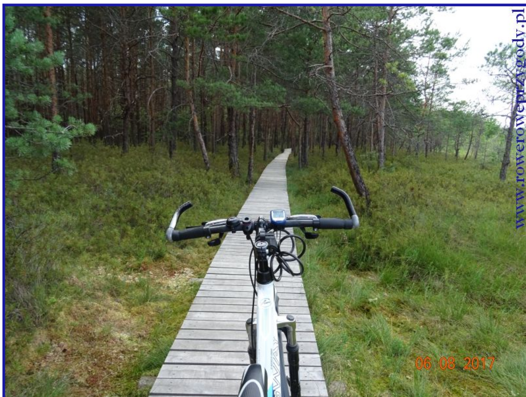
Zdjęcie nr 17 – Szeroka i wygodna do wędrowki pieszej i rowerowej, kładka na ścieżce „Dąb Dominik”.

Podążając pomostem drewnianym po ścieżce przyrodniczej „Dąb Dominik”, zauważymy, że jest on znacznie szerszy, niż na ścieżce „Splawy” (zdjęcia nr 17,18).