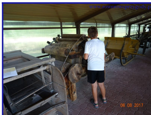
Zdjęcie nr 6 – Wystawa starych maszyn rolniczych przy muzeum w Starym Żaluczu.

Po zwiedzeniu Ośrodka Muzealnego wracamy tą samą drogą asfaltową i po przejechaniu kilkuset metrów skręcamy w prawą stronę, zgodnie z tablicą z napisem: Ścieżka