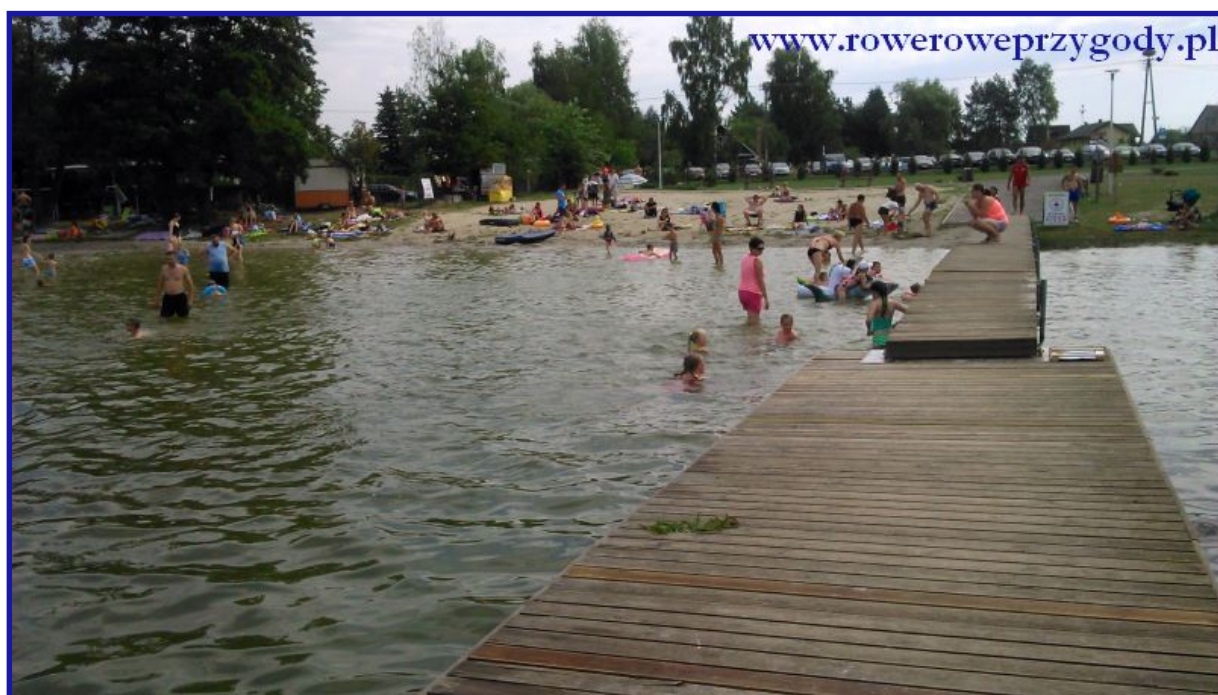
Zdjęcie nr 3 – Kąpielisko na jeziorze Rotcze w miejscowości Grabniak.

około pół kilometra. Chwilę później dojeżdżamy do jeziora Rotcze (zdjęcie nr 3) , gdzie