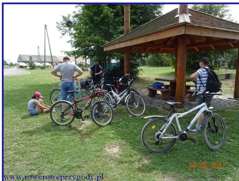
Zdjęcie nr 4 – Wiaty turystyczna przy jeziorze Rotcze w miejscowości Grabniak.

Po przerwie podążamy dalej w kierunku miejscowości Stare Żalucze i po przejechaniu około pół kilometra, dojeżdżamy do rozjazdu dróg, na którym