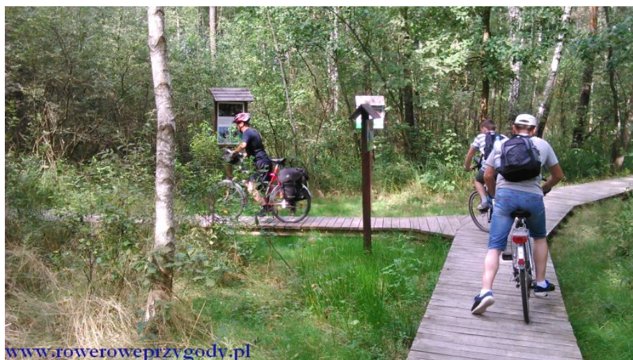
Zdjęcie nr 18 – Rozjazd ścieżek na ścieżce przyrodniczej „Dąb Dominik”.