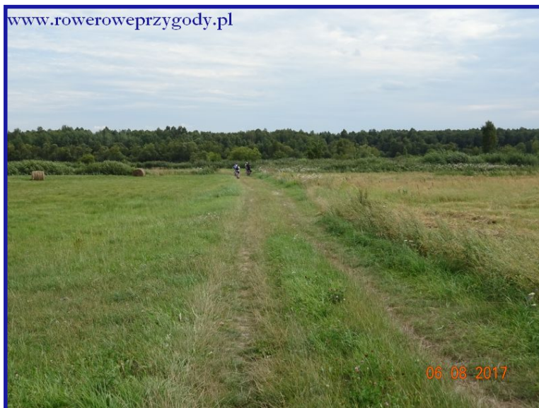
Zdjęcie nr 19 – Droga polna w okolicy miejscowości Jamniki.

Oznaczenie szlaku dotyczy szlaku pieszego, zresztą szybko to zauważymy, gdyż po krótkim czasie okaże się, iż jazda rowerem jest niezbyt łatwa. Droga, którą się poruszamy raczej dla rowerów nie jest przeznaczona. O ile w początkowym odcinku jeszcze da się jakoś jechać, to później (szczególnie w terenie leśnym)