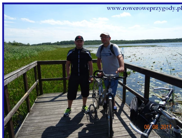
Zdjęcie nr 8 – Jezioro „Łukie” – ostatni przystanek tematyczny na ścieżce przyrodniczej „Splawy”.

Jezioro „Łukie” jest największym jeziorem na terenie Poleskiego Parku Narodowego, posiada powierzchnię około 150 hektarów i głębokość do 6 metrów. Jezioro „Łukie” jest miejscem, które odwiedzane jest licznie przez ptaki, np. w okresie ptasich wędrówek zaobserwować można świstuna, gągola, cyraneczkę itd.. Duża liczba ptaków wodnych przyciąga ptaki drapieżne, zalatuje tu m.in. największy z nich – bielik . Ponadto gnieździ się tutaj np. blotniak stawowy , stąd bardzo często możemy go spotkać (źródła tekstu na końcu Opisu ).