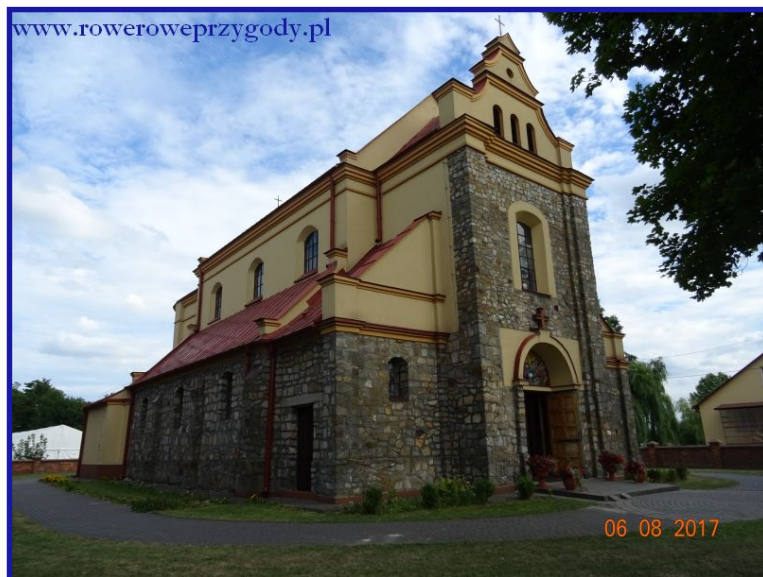
Zdjęcie nr 13 – Murowany kościół pw. św. Izydora w Woli Wereszczyńskiej

Przez Wolę Wereszczyńską przejeżdżamy bardzo szybko i docieramy do miejscowości Łomnica , w której dojedziemy do dużego parkingu, gdzie znajduje się duża wiata turystyczna, z której mogą skorzystać turyści ( zdjęcie nr 14 ). Zresztą i my także skorzystaliśmy, robiąc krótką