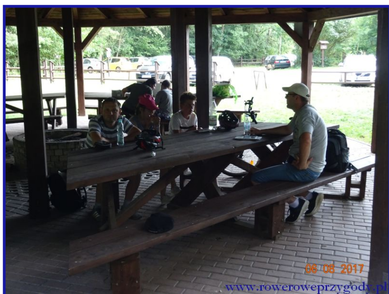
Zdjęcie nr 14 – Wiata turystyczna w Łomnicy – początek ścieżki przyrodniczej „Dąb Dominik”.

przerwę na posiłek. Tutaj też znajdują się miejsca parkingowe dla zmotoryzowanych turystów, którzy mogą sobie np. przyjechać i zwiedzić wyłącznie ścieżkę przyrodniczą „Dąb Dominik”. Z myślą o takich turystach, nawet uruchomiono miejsce, gdzie można kupić bilet wstępu na płatną ścieżkę ”Dąb Dominik” .