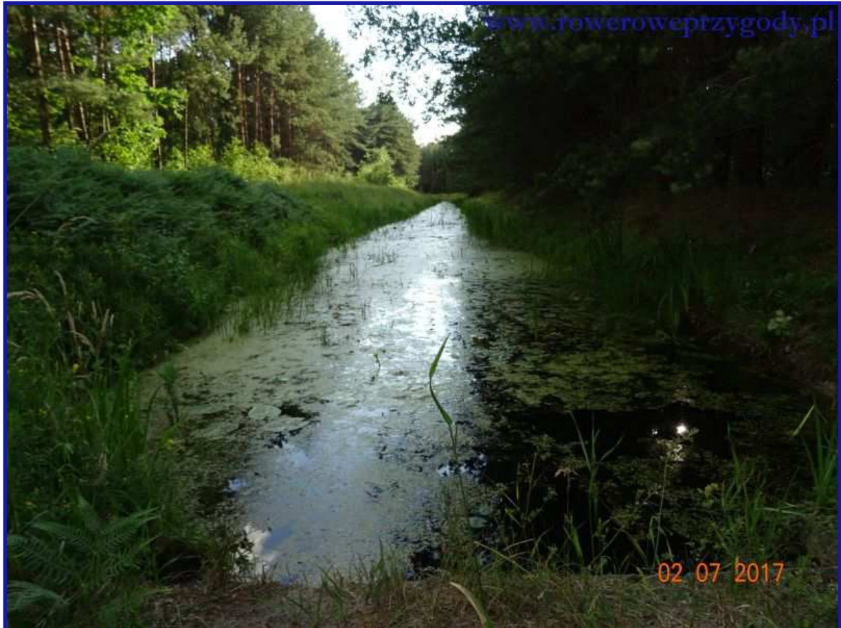
Zdjęcie nr 22 - Leśna rzeczka na terenie Parku Poleskiego pomiędzy Babskiem a Urszulinem.

Aby dostać się do parkingu, na którym pozostawiliśmy samochód, musimy skręcić w prawą stronę i przejechać znaną nam już drogą nr 82 niewielki dystans, po którym dojedziemy do Ośrodka Dydaktycznego Parku.