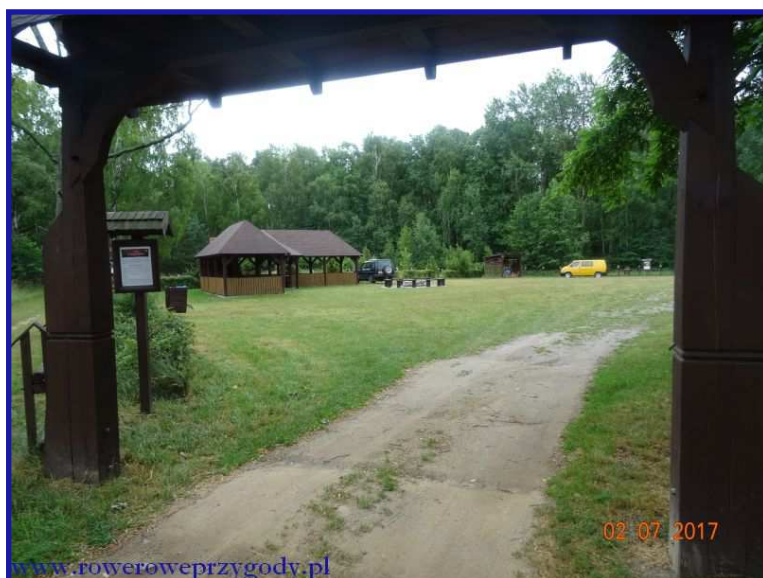
Zdjęcie nr 14 - Pole namiotowe i parking w okolicy Pieszowoli.

W międzyczasie zauważymy, że szlak zmienił się na kolor czarny, mijamy po lewej stronie małe jezioro zwane Stawem Głębokim . Jest to jeden ze stawów, wchodzących w skład całego kompleksu stawów. Za chwilę miniemy również duży przystanek turystyczny, gdzie znajduje się również parking oraz pole namiotowe ( zdjęcie nr 14 ). Przed nami rozjazd, na którym znajdują się drogowskazy, kierujące nas do różnych atrakcji