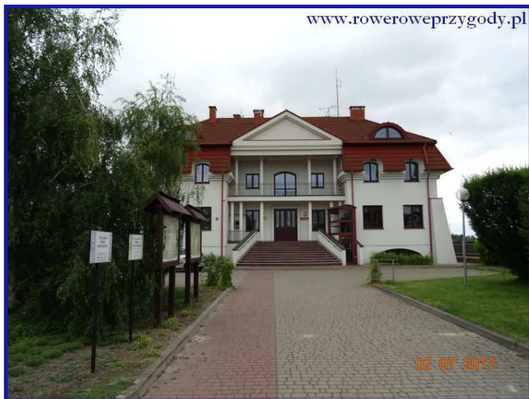
Zdjęcie nr 2 - Ośrodek dydaktyczno-administracyjny Poleskiego Parku Narodowego w Urszulinie.

blotne. Funkcje tego budynku oraz ciekawostki, z których można skorzystać przedstawię w jednym z opisów, który zamierzam sporządzić w przyszłości.