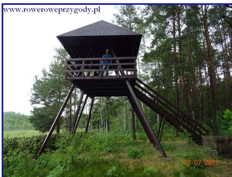
Zdjęcie nr 8 - Wieża widokowa na wschodnim skraju torfowiska „Durne Bagno”

Jak możemy wyczytać na tablicy informacyjnej, znajdującej się przy wieży, torfowisko wysokie jakim jest „ Durne Bagno ” w okresie wiosennym gromadzi znaczną ilość wody, dzięki czemu pęcznieje i wznosi się w środkowej części, tworząc kopulastą formę. Natomiast obrzeża ulegają podtopieniu.