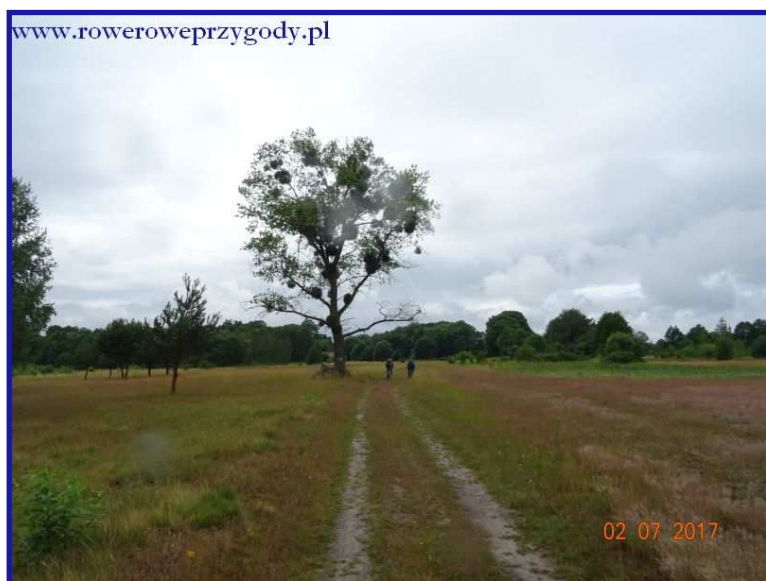
Zdjęcie nr 12 - Samotnie stojące drzewo, zaatakowane przez jemiolę.

Jadąc zaobserwujemy ciekawy efekt, otóż na końcu lasu zobaczymy coś przypominającego światło w tunelu. Jest to wyjazd z lasu na otwarte tereny, do których za chwilę dojedziemy.