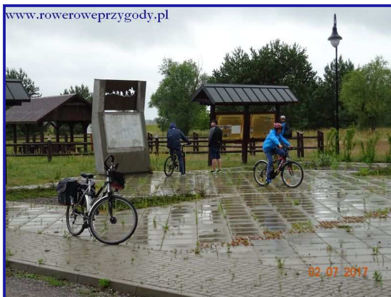
Zdjęcie nr 7 - Tablice informacyjne przy pomniku żołnierzy WOP pod Wytycznem.

Jak widać na zdjęciu nr 6, pogoda w czasie wycieczki nie była za rewelacyjna, czasami padał deszczyk, ale nie wpływało to na nasze humory.