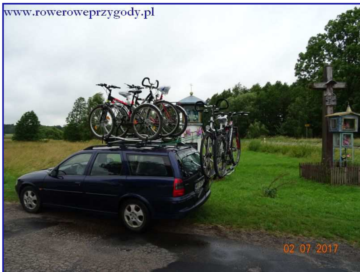
Zdjęcie nr 1 - Krótka przerwa w drodze do Poleskiego Parku Narodowego

Dzisiejsza wycieczka rowerowa jest szczególna w dwojaki sposób. Otóż rozpoczyna serię wycieczek po Poleskim Parku Narodowym, który w tym roku zamierzam dokładnie zwiedzić i opisać w formie kilku propozycji wycieczek, po drugie warto wspomnieć, iż po raz pierwszy od momentu zakupu dodatkowego uchwyty na rowery (mocowanego na tylną klapę samochodu) wybraliśmy się jednym samochodem w pięć osób, przewożąc w nim bagaże, 5 rowerów oraz oczywiście samych siebie. Wspominam o tym nie bez powodu. Otóż jest to dowód na to, żeby podróżować grupą osób np. rodziną lub grupą przyjaciół, nie ma potrzeby angażować kilku samochodów, co może wiązać się z pojawieniem się niechęci do odbycia wycieczki. Wystarczy jeden samochód i to jak widać na przykładzie mojej Vectry z 1999 r, wcale nie musi być szczególnie nowy, żeby fajnie spędzić razem dzień zwiedzając piękne okolice. Na zdjęciu poniżej przedstawiłem, jak wygląda samochód osobowy załadowany pięcioma rowerami ( zdjęcie nr 1 ).