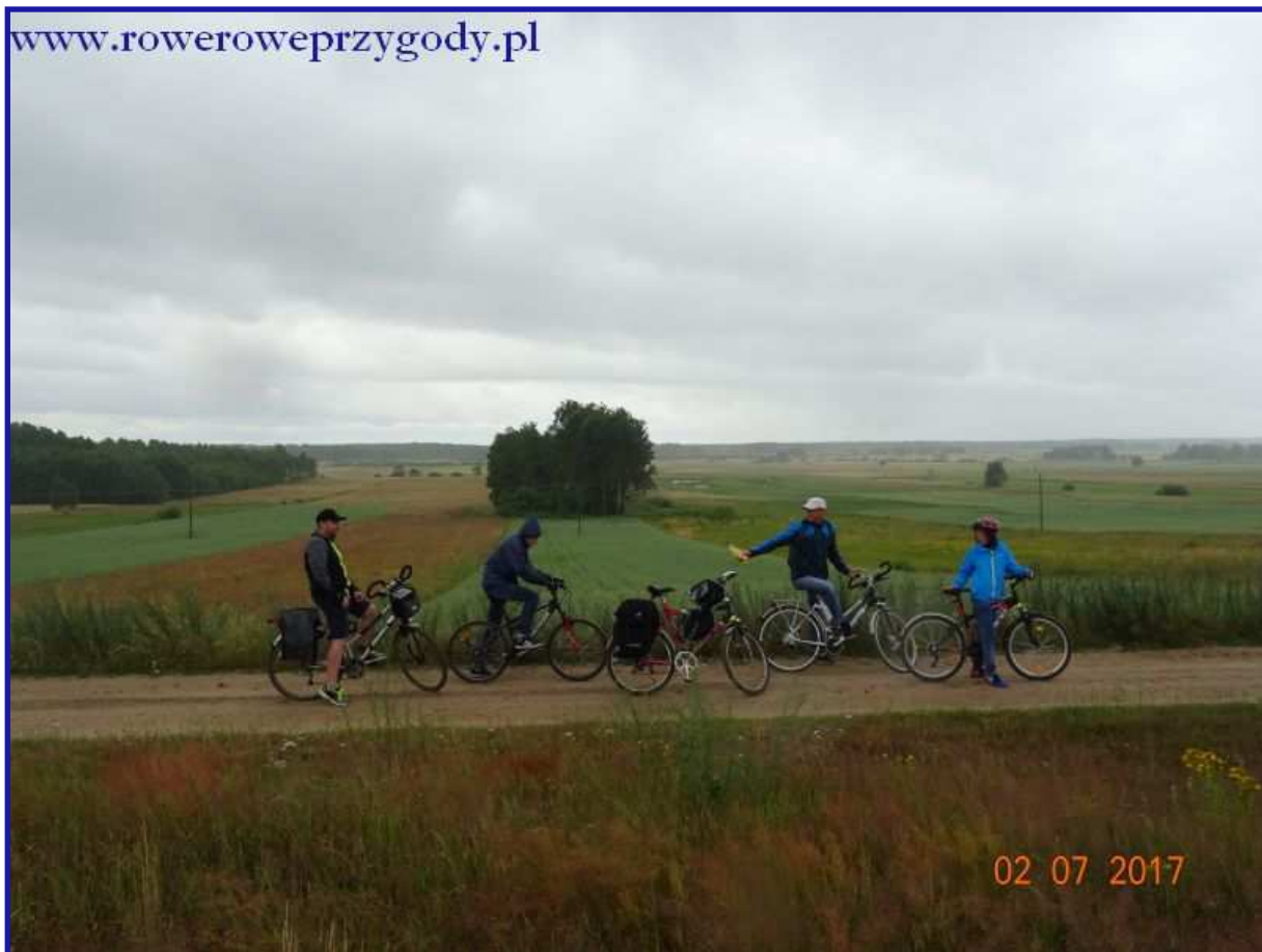
Zdjęcie nr 11 - Piękny widok na łąki w okolicy miejscowości Wielki Łan (na pierwszym planie uczestnicy wycieczki).

Jadąc zaobserwujemy ciekawy efekt, otóż na końcu lasu zobaczymy coś przypominającego światło w tunelu. Jest to wyjazd z lasu na otwarte tereny, do których za chwilę dojedziemy.