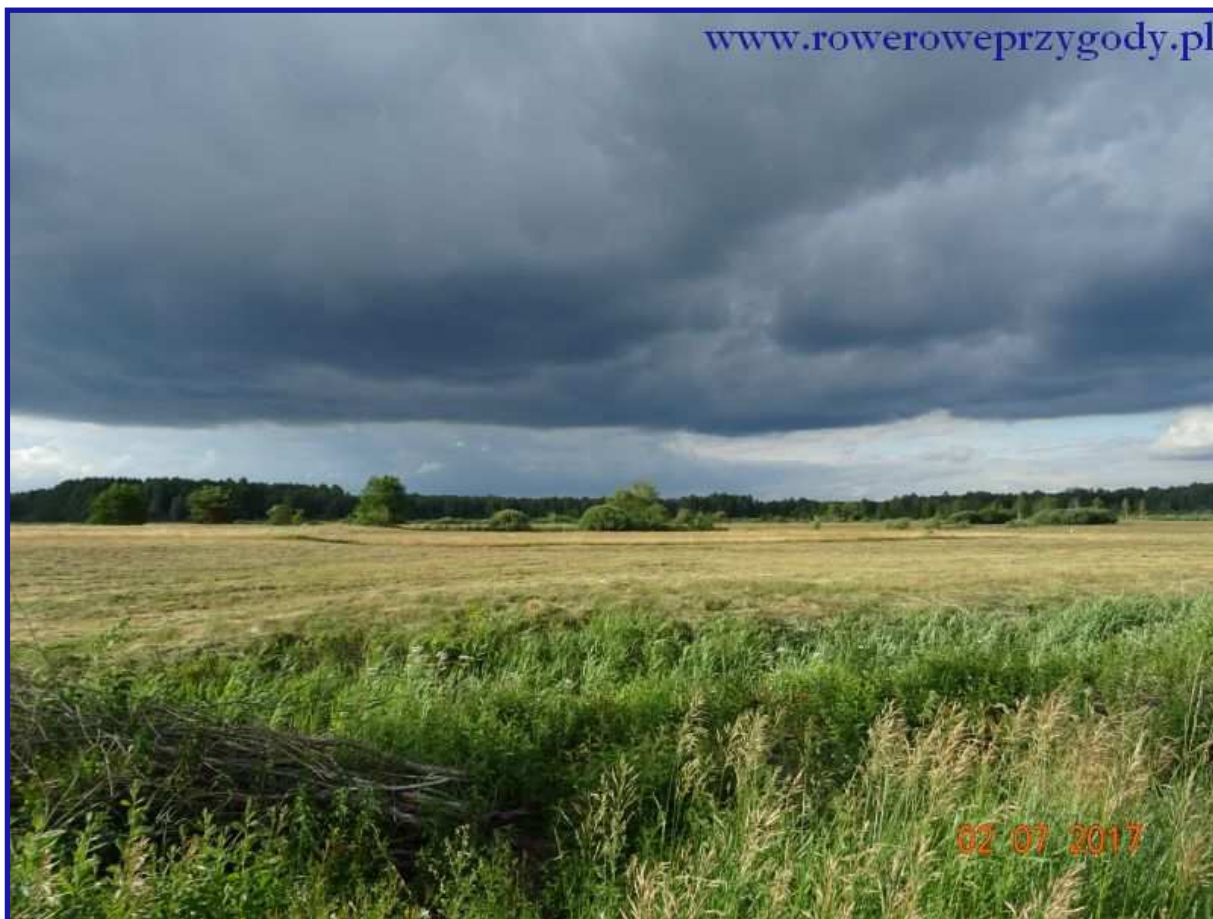
Zdjęcie nr 21 - Ciemne, burzowe chmury nad łąkami w okolicy miejscowości Wola Wereszczyńskiej.

Jadąc, chwilę potem dojedziemy do większej drogi asfaltowej, przy której po prawej stronie zobaczymy cmentarz rzymskokatolicki. Wyjechaliśmy w pobliżu miejscowości Babsk , gdzie po przejechaniu niewielkiego odcinka, skręcamy w lewą stronę, w drogę polną, oznaczoną czerwonym szlakiem turystycznym.