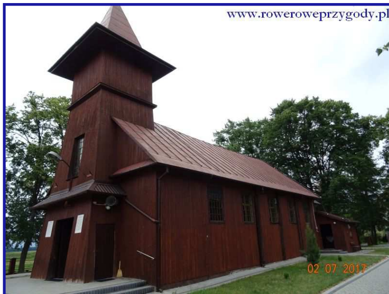
Zdjęcie nr 4 - Drewniany kościół z 1949 r. pw. św. Andrzeja Boboli na obrzeżach wsi Wytyczno.

Przejeżdżając niewielki odcinek, pojawi nam się w całej okazałości jezioro Wytyckie ( zdjęcie nr 5 ). Warto zjechać z drogi kilkadziesiąt metrów, by stanąć na jego brzegu. W dniu wycieczki wiał dosyć silny wiatr od strony jeziora, przez co dało się wyczuć charakterystyczny zapach jeziora, taki sam zapach można