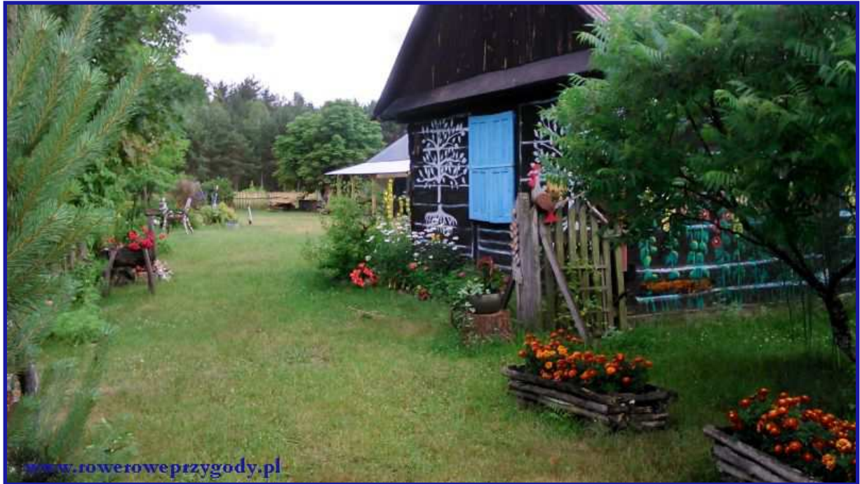
Zdjęcie nr 10 - Pięknie ozdobione domy letniskowe w okolicy miejscowości Nowiny.

Poruszamy się szlakiem zielonym, niebieskim i także fragmentem szlaku konnego o kolorze żółtym. Delektując się jazdą rowerową, dojedziemy do miejsca, gdzie znajduje się kilka drewnianych domów, pięknie ozdobionych. Chwilę zatrzymaliśmy się przy nich, podziwiając ich wygląd ( zdjęcie nr 10 ).