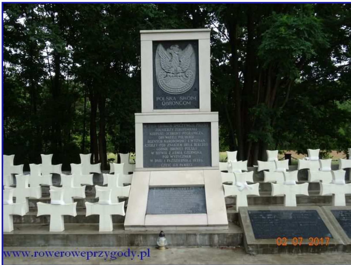
Zdjęcie nr 6 - Pomnik upamiętniający walkę żołnierzy WOP z najeźdźcą sowieckim pod Wytycznem w 1939 r.

Jak widać na zdjęciu nr 6, pogoda w czasie wycieczki nie była za rewelacyjna, czasami padał deszczyk, ale nie wpływało to na nasze humory.