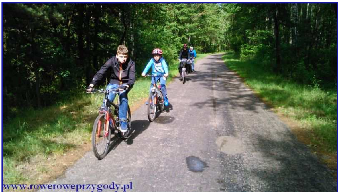
Zdjęcie nr 19 - Droga pośród lasów pomiędzy Lipniakiem a miejscowością Jamniki.

Pokonawszy trasę złożoną z drewnianych kładek, wracamy z powrotem do miejscowości Lipniak , małej wsi, składającej się z kilku zabudowań i dalej podążamy drogą, pokrytą starym, popękany asfaltem. Przed nami dosyć długi, kilkukilometrowy odcinek, przebiegający przez zróżnicowany krajobraz, w którym dominują lasy, głównie liściaste. Mijamy po drodze m.in. klony oraz inne drzewa, w tym również iglaste głównie