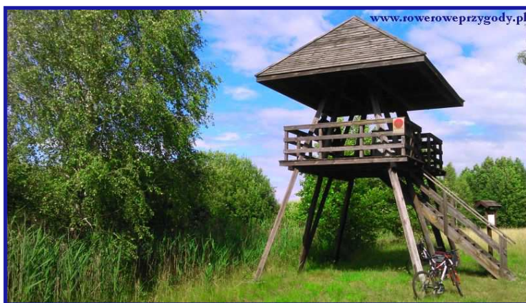
Zdjęcie nr 17 - Wieża widokowa na skraju Łąk Zienkowskich.

Jak zauważymy podążając dalej, że nasza trasa teraz zawraca i co najlepsze prowadzi nas przez charakterystyczne kładki drewniane (zdjęcie nr 18), lekko wzniesione ponad ziemię. Jak informuje nas jedna z tablic, po kładkach nie wolno jeździć rowerem. Ale jak tu się