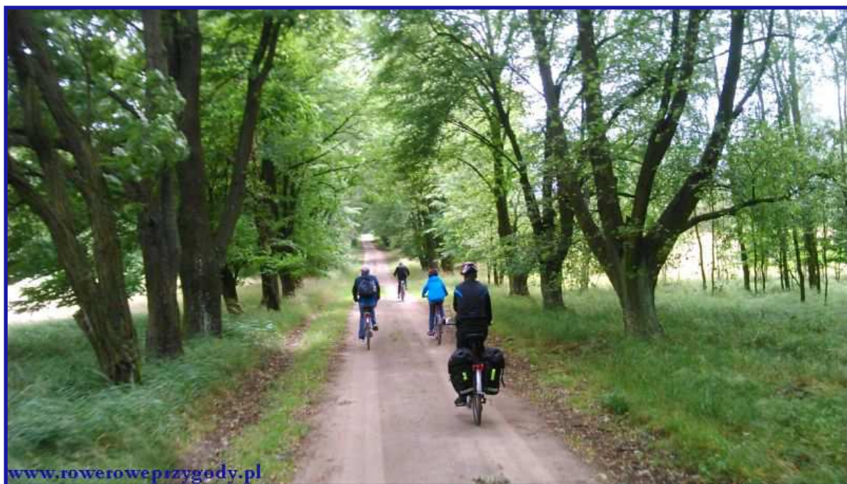
Zdjęcie nr 13 - Przyjemna do jazdy rowerem aleja lipowa w okolicy miejscowości Pieszowola.

Jak z pewnością zauważymy coraz bardziej zbliżamy się do drogi nr 819 a dokładnie do miejscowości Pieszowola . Nie dojeżdżając do tej miejscowości, skręcamy w lewą stronę, w kolejną drogę piaskową, przy czym oznaczenia szlaku zmieniają się z dotychczasowego niebieskiego na zielony. Mijamy pojedyncze zabudowania letniskowe. Droga prowadzi nas następnie przez uroczą aleję lipową, wzdłuż której jazda rowerowa jest prawdziwą przyjemnością ( zdjęcie nr 13 ).