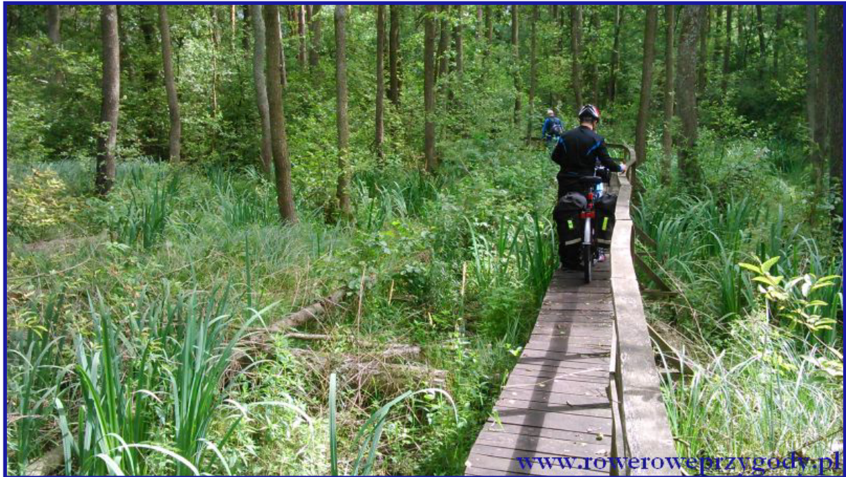
Zdjęcie nr 18 - Pomost drewniany na ścieżce edukacyjnej „Obóz Powstańcy”.